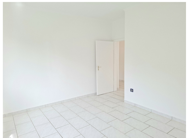
Schlafzimmer Bild 2