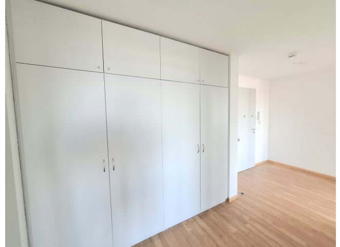
Diele mit Einbauschränk