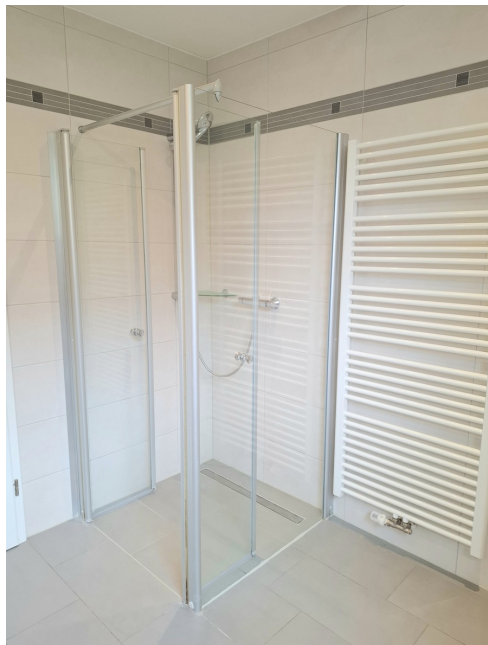
Duschbad Bild 2