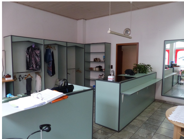
Verkaufsfläche Bild 3