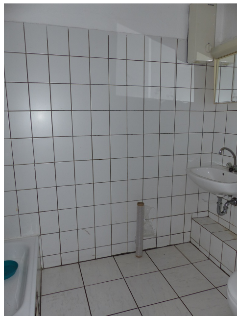
WC mit Dusche

Vorbehaltlich weisen wir darauf hin, dass die Objektangaben auf Informationen des Eigentümers beruhen und von uns nicht weiter überprüft worden sind, deshalb übernehmen wir keine Gewähr für deren Richtigkeit.