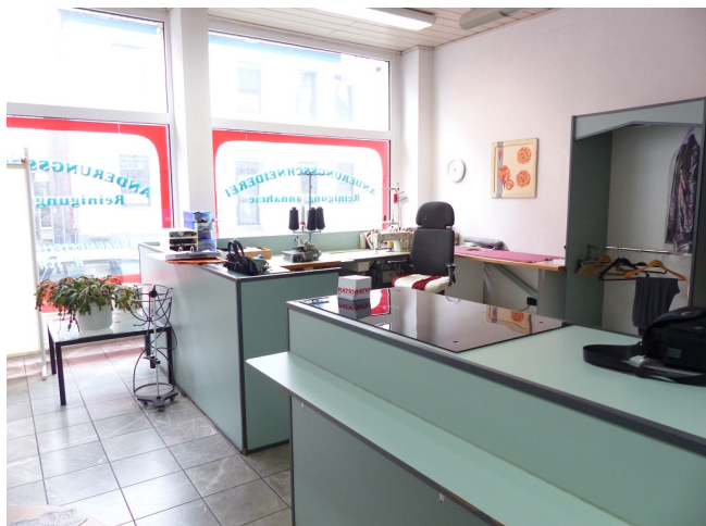
Verkaufsfläche Bild 2