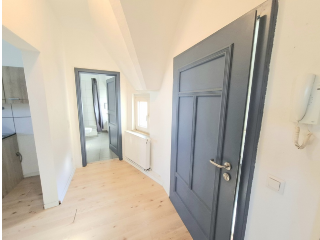
Diele / Eingangsbereich