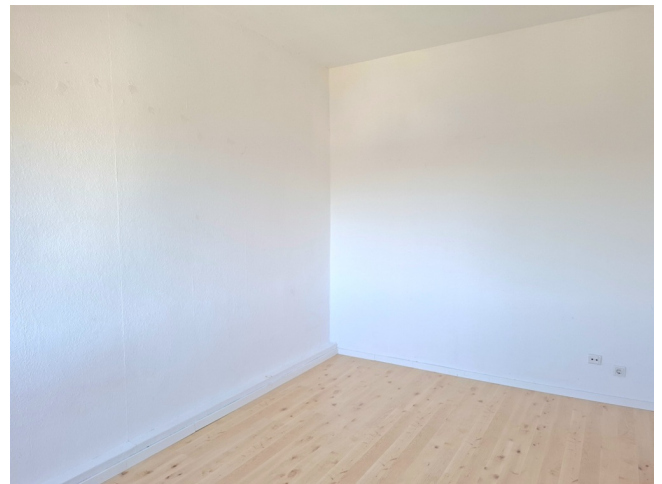
Schlafzimmer Bild 2