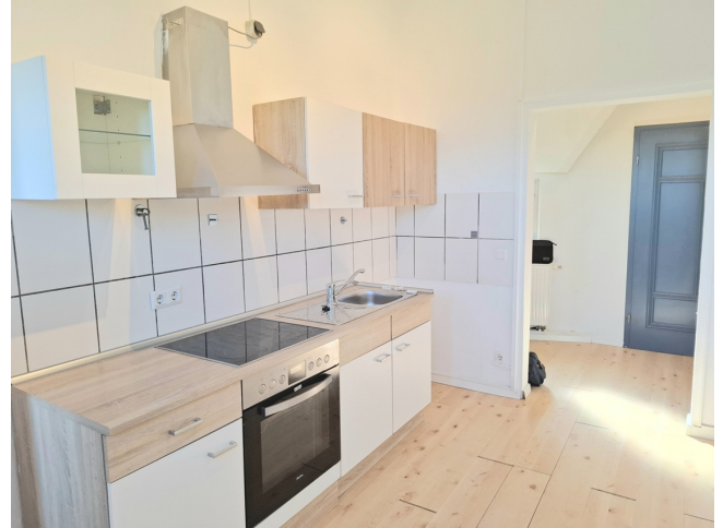
Küche Bild 2