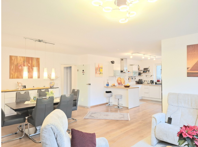
Wohnzimmer Bild 2