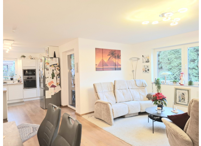
Wohnzimmer Bild 3