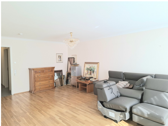
Wohnzimmer Bild 2