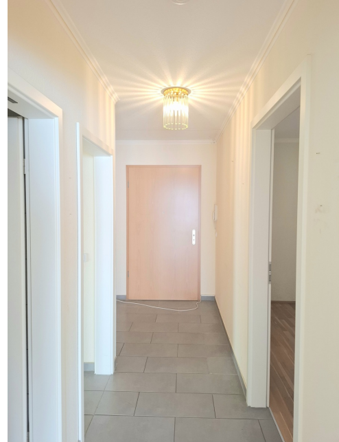
Eingangsbereich / Diele