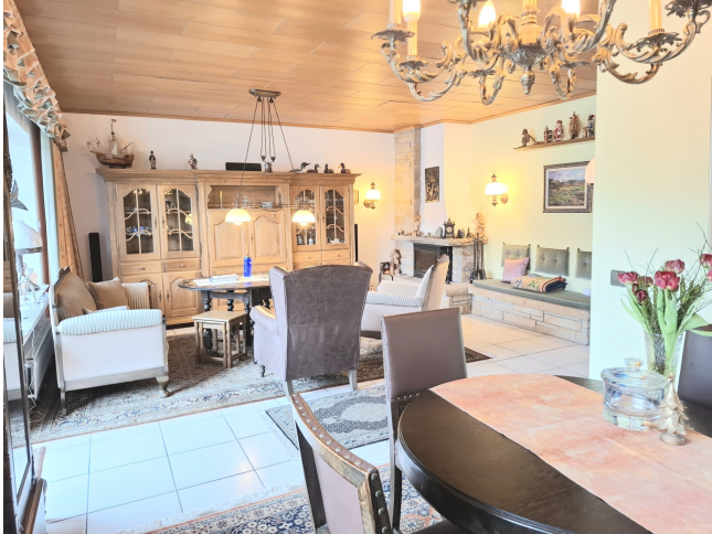
Wohn- / Esszimmer Bild 2