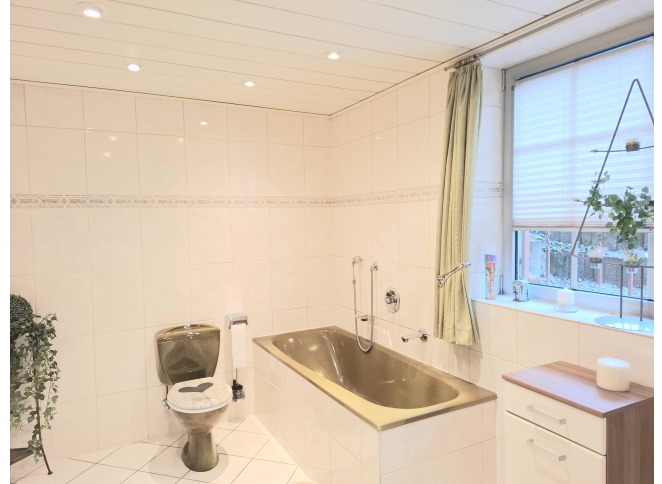
Badezimmer Bild 2