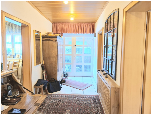
Diele / Eingangsbereich