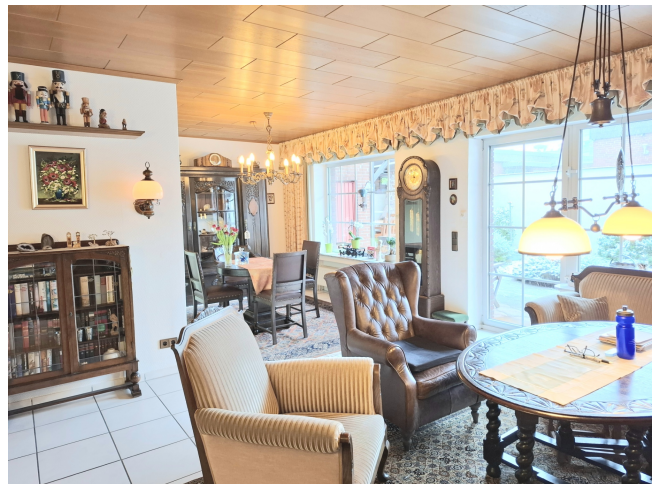
Wohn- / Esszimmer