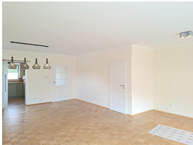
Wohnzimmer Bild 3