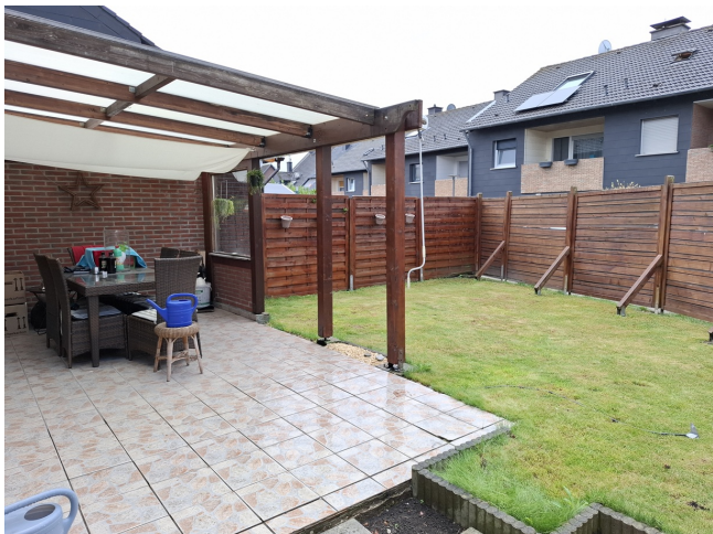
Garten / Terrasse