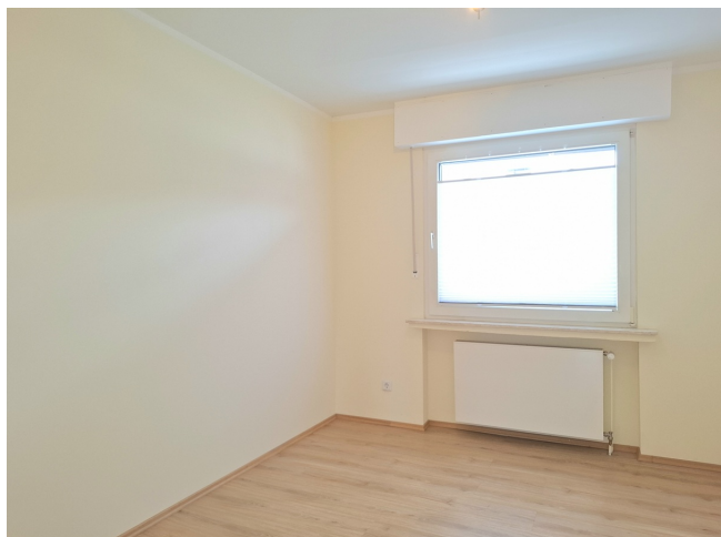
Kinder- / Arbeitszimmer