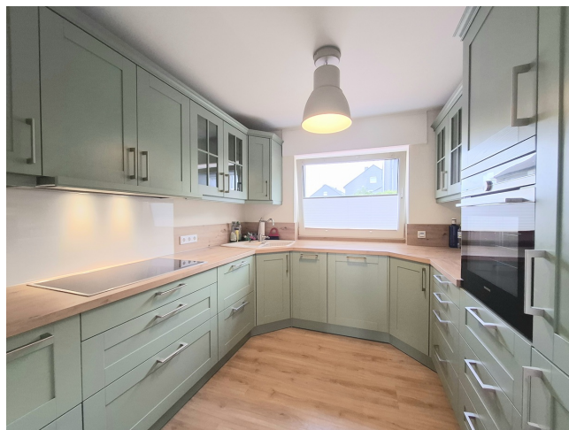
Küche Bild 2

Vorbehaltlich weisen wir darauf hin, dass die Objektangaben auf Informationen des Eigentümers beruhen und von uns nicht weiter überprüft worden sind, deshalb übernehmen wir keine Gewähr für deren Richtigkeit.