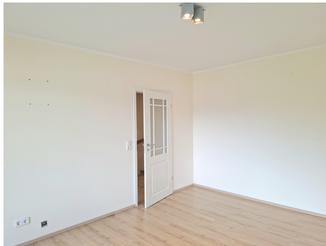
Schlafzimmer Bild 2