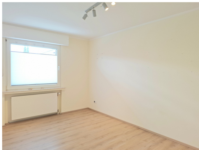
Kinder- / Arbeitszimmer 2

Vorbehaltlich weisen wir darauf hin, dass die Objektangaben auf Informationen des Eigentümers beruhen und von uns nicht weiter überprüft worden sind, deshalb übernehmen wir keine Gewähr für deren Richtigkeit.