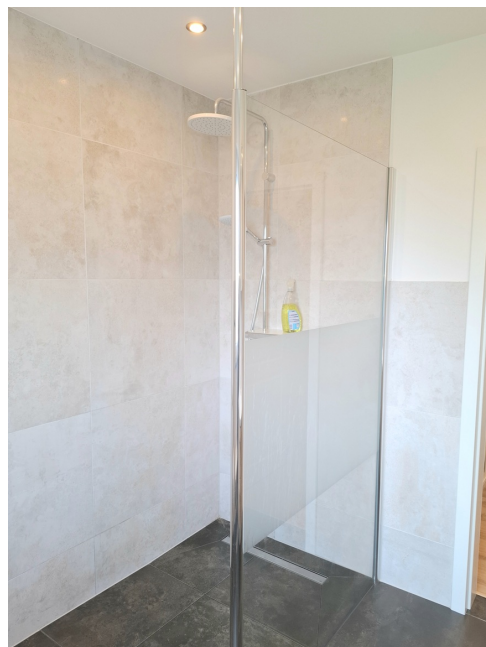
Badezimmer Bild 2