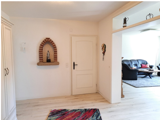
Diele EG Bild 2