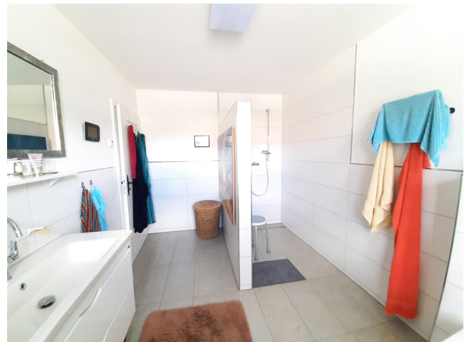
Badezimmer EG Bild 2