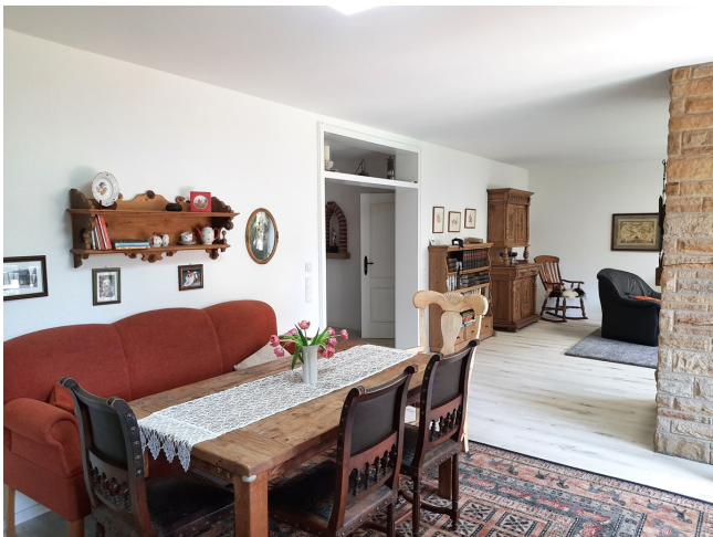
Esszimmer EG Bild 2