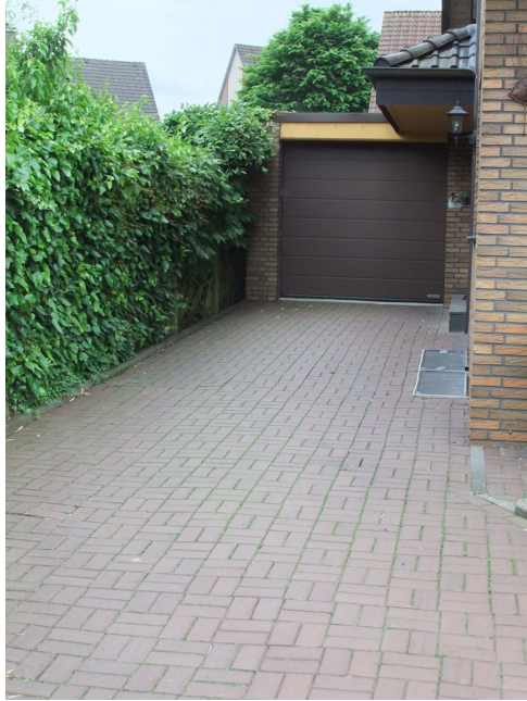
Hauseingang linke Seite