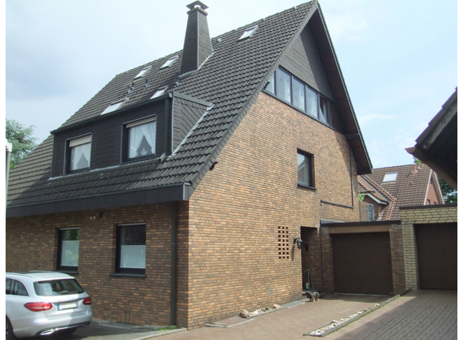
Hauseingang EG-Wohnung rechte Seite