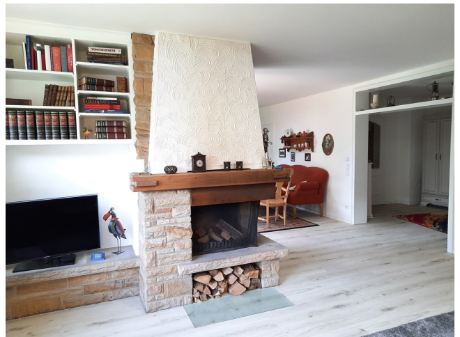
Wohnzimmer EG Bild 2