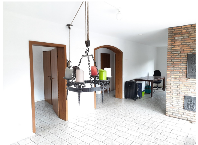
Wohn-/Esszimmer OG Bild 2