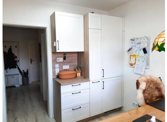
Küche EG Bild 2