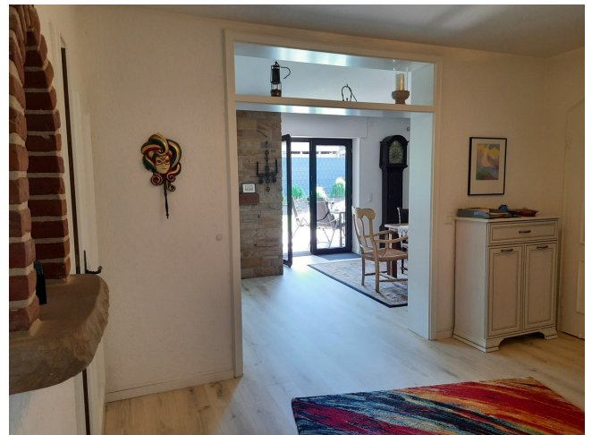
Diele EG Bild 3