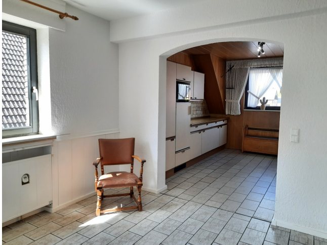
Küche Bild 2 OG