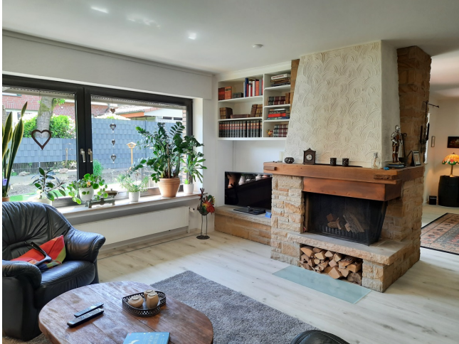
Wohnzimmer EG Bild 3