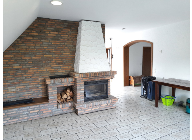
Wohnzimmer OG Bild 2