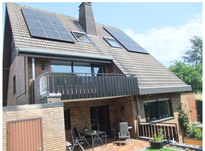
Hausrückansicht Bild 2