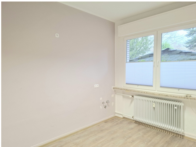
Pausenraum / Teeküche