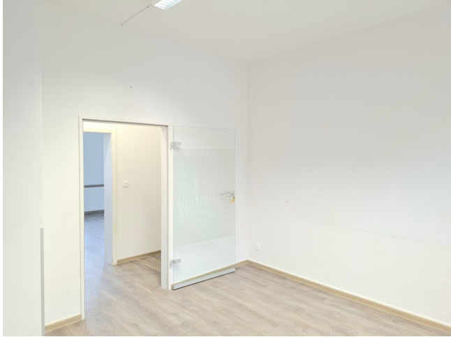
Bürraum 1 Bild 2