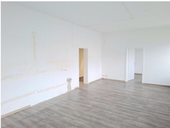
Geschäftsraum Bild 2