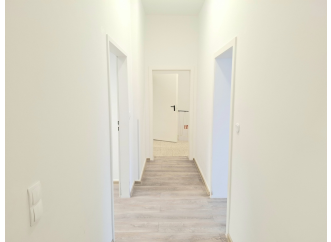
Diele Bild 2