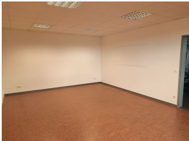
Schulungs-/Besprechungsraum Bild 2