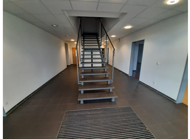
Eingangsbereich Bild 2